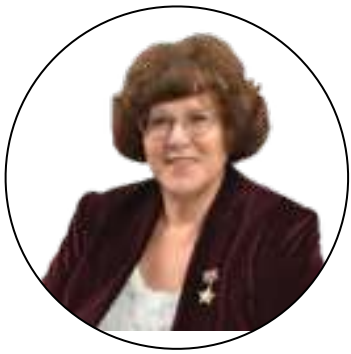
Natalia Boeva/ Наталья Боева

Director of the Department of economy, investments and regulation of agricultural markets Ministry of agriculture of Russian Federation/ Директор Департамента экономики, инвестиций и регулирования рынков АПК Министерства сельского хозяйства РФ