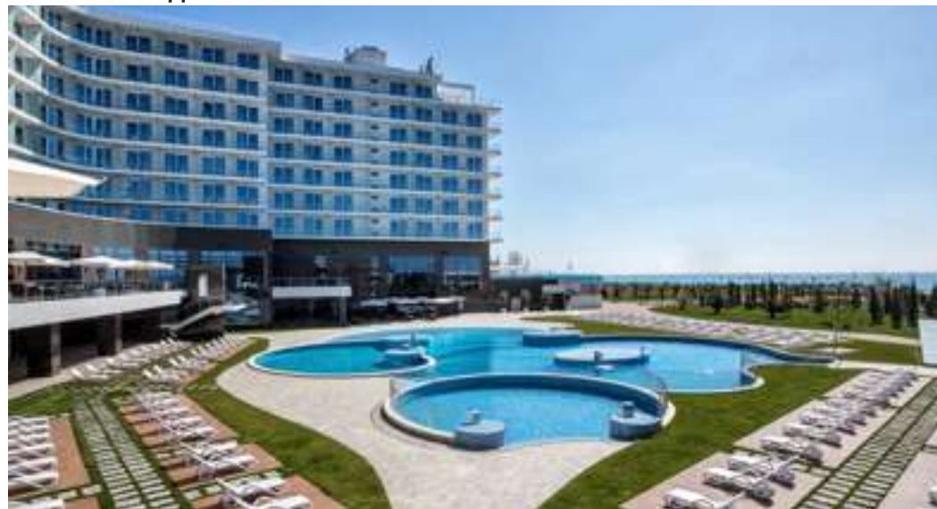
МЕСТО ПРОВЕДЕНИЯ / VENUE

Время заезда – 14:00, время выезда – 12:00. Гостям предоставляется возможность открытия депозита на оплату дополнительных услуг отеля, таких как полностью заполненный мини-бар, ресторанное обслуживание в номерах, услуги ресторанов и баров, процедуры СПА и услуги прачечной.