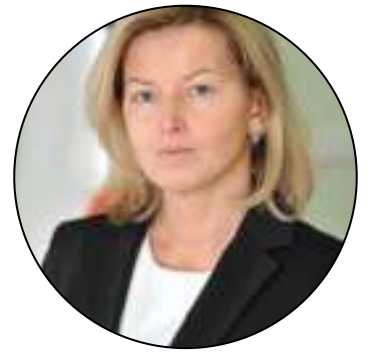
Olga Abramova/ Ольга Абрамова

Deputy Prime Minister of the Government of the Republic of Bashkortostan Minister of Agriculture of Bashkortostan/Заместитель Премьер-Министра Правительства Республики Башкортостан, Министр сельского хозяйства Республики Башкортостан