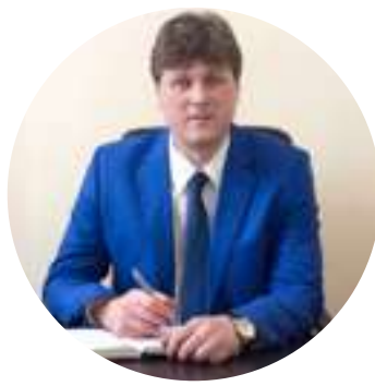
Konstantin Sinetsky/ Константин Синецкий

Deputy Governor of Tomsk Region for Agroindustry and Natural Resource Management/ Заместитель Губернатора Томской области по агропромышленной политике и природопользованию