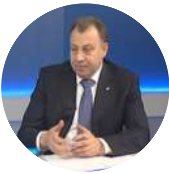
Andrey Knorr/ Андрей Кнорр

Minister of Agriculture and Food of Moscow region/ Министр сельского хозяйства и продовольствия Московской области