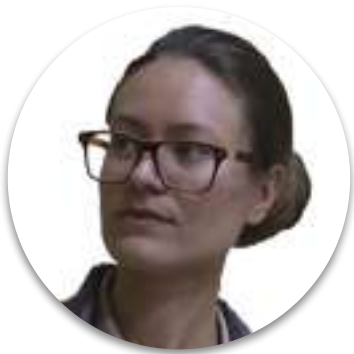
Ekaterina Zakharova/ Екатерина Захарова

Minister of agriculture and food of the Udmurt Republic/ и.о. Министр сельского хозяйства и продовольствия Удмуртской Республики